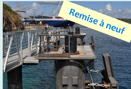
Remise à neuf

Le pré-tripage est l'action qui consiste en la vérification du bon fonctionnement des conteneurs frigorifiques avant leur départ pour l'export, service disponible au port.